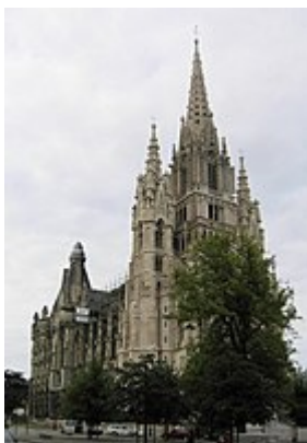
Koninklijke Kerk (Laken)