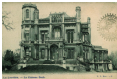
Kasteel La Closière (La Louvière)