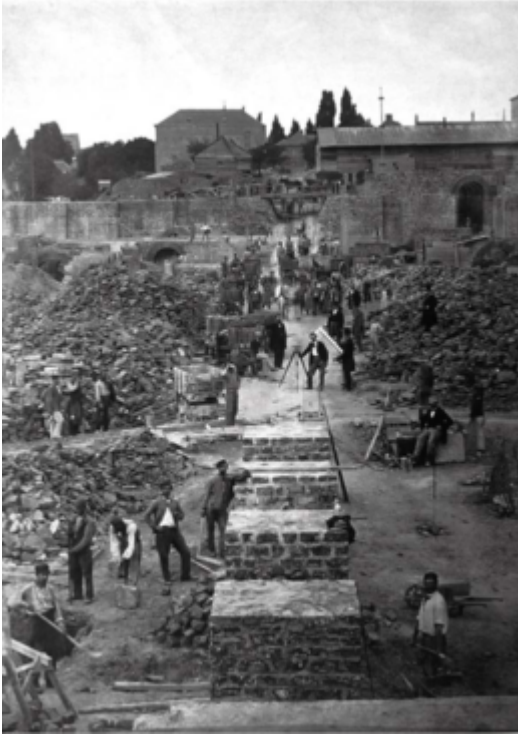
Foto van Poelaert die al opmetend poseert bij de funderingen van het Justitiepaleis