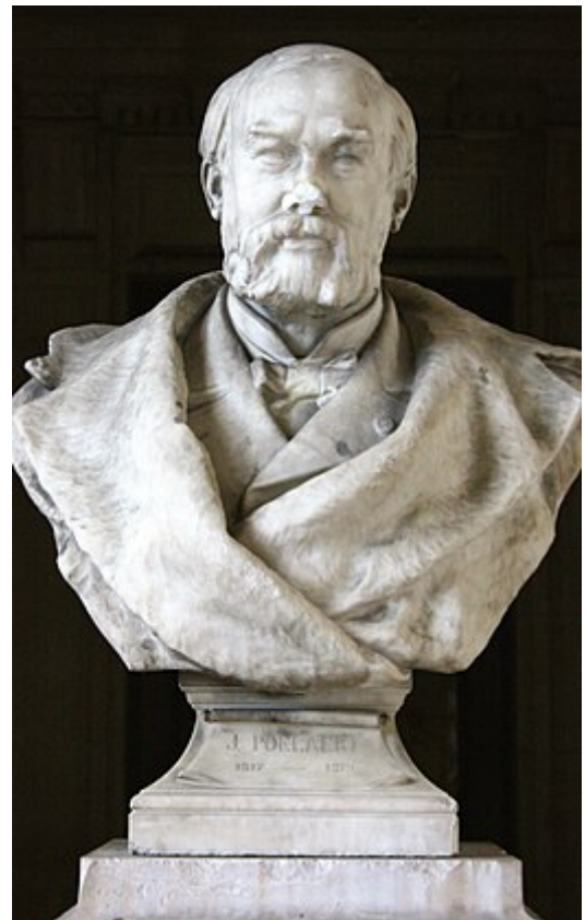
Borstbeeld van Poelaert in het Justitiepaleis te Brussel