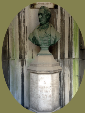
de Beriot - Détail