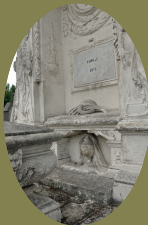
Suys - Détail