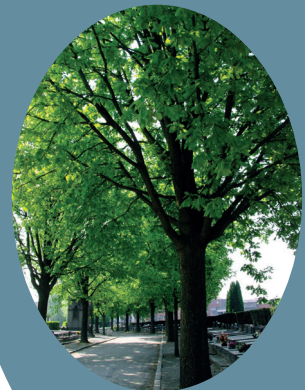
Quercus frainetto : d