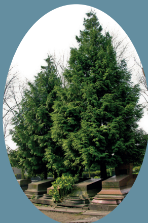
Thuja : i