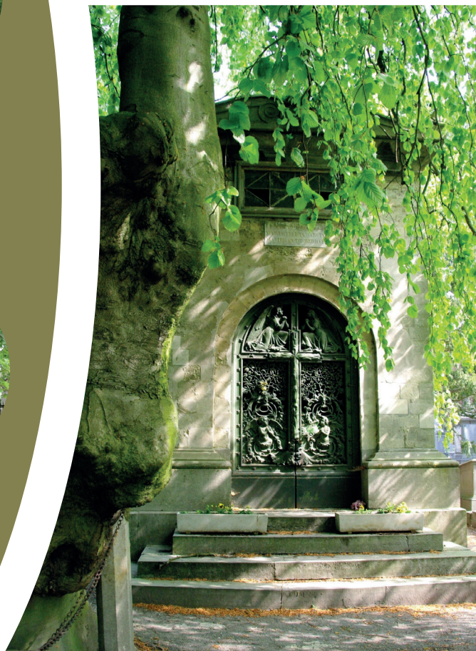
Fagus sylvatica pendula hangend over de graf van "la Malibran".

Belangrijkste parketfabrikant van België ; hij produceerde met name het parket van de gotische zaal van het Stadhuis, van het Koninklijk Paleis en van het Rekenhof. Het is een familiemausoleum waarvan de neogotische « pinakel » werd gerealiseerd door het atelier Ernest Salu. 50