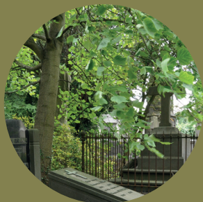
Liriodendron tulipifera : h