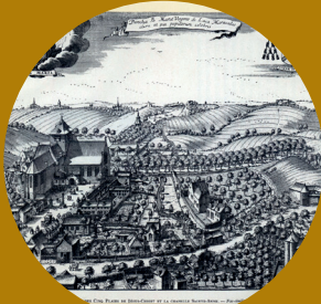
Oude kerk van Laken, XVII e eeuw

De eerste afbeeldingen van de kerk en van het kerkhof dateren van de XVII e eeuw.