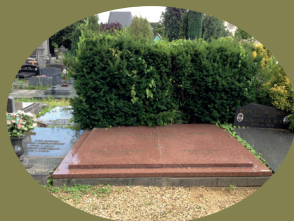
De Riemaecker - Legot

Ze was de eerste vrouwelijke minister van België ; tijdens de regeerperiodes van Harmel en van Vanden Boeynants I, bezette ze van 1965 tot 1968 de post van Minister van Familie en van Huisvesting. 36