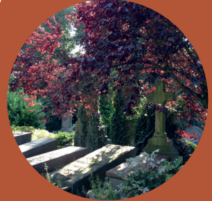
Fagus Sylvatica purpurea : l

Het kerkhof is sinds 1999 geklasseerd en het onderhoud is klassiek : elk seizoen worden er bloemplanten in de bloemperken geplant, grasperken worden gemaaid, bladeren geharkt, er wordt voornamelijk handmatig gewied, de dreven en de hagen worden onderhouden...We vermelden eveneens de recente installatie van geotextiel onder de gangpaden om de veropreiding van onkruid op de paden te beperken.