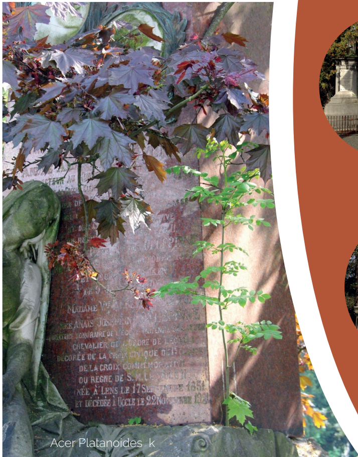
Acer Platanoides k