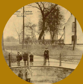
Bron en kapel Sint-Anna

Jozef Poelaert won de architectuurwedstrijd voor de bouw van de kerk onder het pseudoniem Paul du Bois.