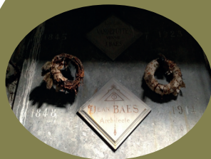
Baes (galeries funéraires)

Hij bouwde het Vlaams Koninklijk Theater in een heel persoonlijke neorenaissancestijl. Zijn graf is in hardsteen (blauwe steen), met trapezoïdale vormen en versierd met ronde motieven. 13