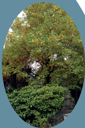
Liriodendron tulipifera : h