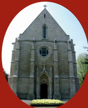
Koor van de oude kerk

Bij de afbraak van de oude kerk werd het koor uit 1275 bewaard en omsloten door een nieuwe gevel die het neogotisch portaal van Louis de Curte integreerde ; deze laatste had, door de controversiële begrafenis van Koning Leopold I, de Sint-Barbarakapel voorzien van een aparte ingang. 3