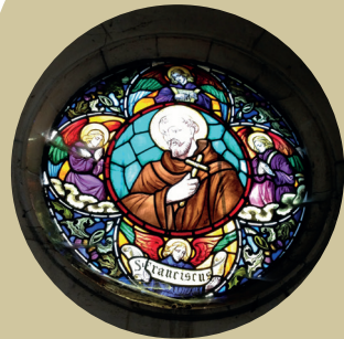
Detail kapel Vaxellaire