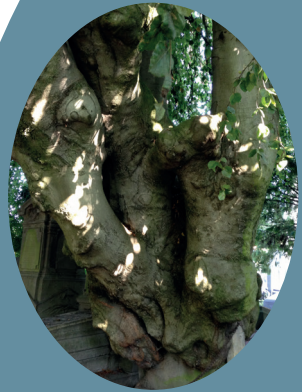
Fagus sylvatica pendula : a