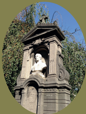
Wyns de Raucourt