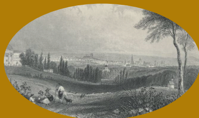
Residentie Schoonberg, oude kerk en kapel rond 1750