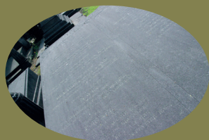
Navez et Portaels