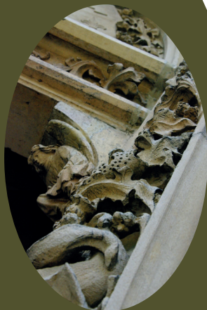
Détail neogotische kerkportaal