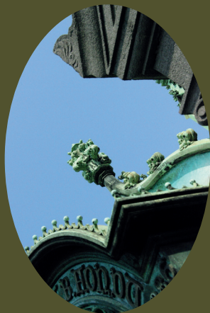
Detail Fondu kapel