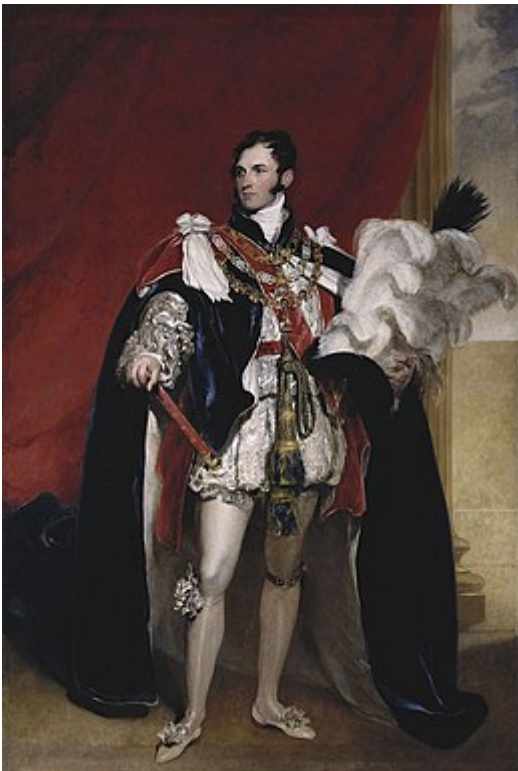
Leopold als Ridder van de Kousenband. Portret door Thomas Lawrence uit 1821, hangend in de Waterloo Chamber van Windsor Castle .

Leopold pendelde tussen Duitsland en Rusland , en ook in Parijs was hij bekend. Hij was een van de meest invloedrijke diplomaten uit zijn tijd. In het gevolg van de tsaar Alexander I nam hij deel aan het Congres van Wenen , waar hij indruk maakte met zijn intellect, milde ironie en zijn looks. De vrouw van Lodewijk Napoleon , Hortense de Beauharnais , liet zich ontvallen nog nooit zo'n mooie man te hebben ontmoet. Uit bronnen is bekend dat Leopold een van de meest aantrekkelijke partijen was en deze natuurlijke voorsprong werd mee uitgebuit door zijn moeder.