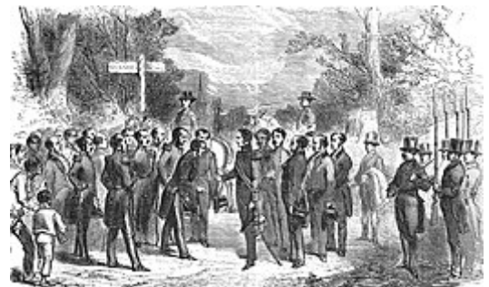
Aankomst van Leopold I aan de Belgische grens. De Panne, 17 juli 1831.

Leopold aanvaardde de Belgische troon op voorwaarde van een duidelijk grensverdrag met Nederland. Hiertoe werd het Verdrag der XVIII artikelen opgesteld, dat de grens tussen Nederland en België teruglegde op die van 1790 . Het verdrag werd ondertekend door de grote mogendheden Frankrijk, Verenigd Koninkrijk, Pruisen en Rusland. Na behoorlijk wat discussie stemde het Belgische Nationaal Congres op 9 juli 1831 in met het verdrag, met 126 stemmen tegen 70. [5] Nederland weigerde het traktaat echter te ondertekenen en stuurde aan op de Tiendaagse Veldtocht . Na de instemming had Leopold geen bezwaren meer. De koning had het wel moeilijk met de beperkte politieke macht van de monarch. Later sprak hij zelfs van een politiek dwangbuis. Gedurende zijn hele bewind probeert hij tegen de grondwet in steeds meer persoonlijke macht te verwerven. Slechts geleidelijk stuit hij op verzet van de regering.