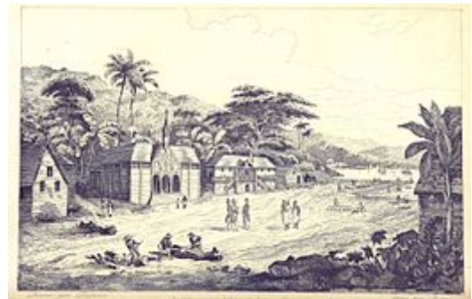
De Belgische nederzetting in Santo Tomás in 1844

Onder het bewind van koning Leopold I werden meerdere kolonisatiepogingen ondernemen, zoals onder meer in Santo Tomás in Guatemala door de Compagnie Belge de Colonisation . Ten tijde van het koloniseren van de Belgische kolonie aan de Rio Nuñez waren er Belgen betrokken bij het Incident aan de Rio Nuñez , nabij Boké , in 1849.