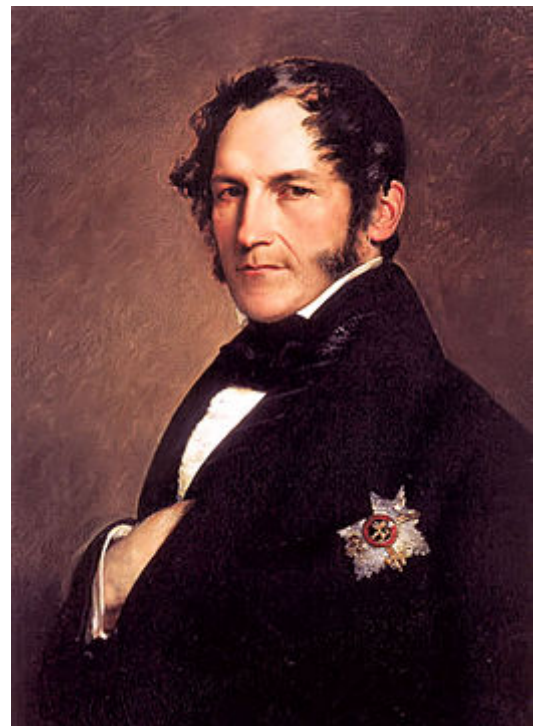
Burgerlijk portret van Leopold I door Franz Xaver Winterhalter , 1839

Het Nationaal Congres besloot in decreet nr. 4 van 22 november 1830 dat het onafhankelijke België een parlementaire constitutionele monarchie zou worden. Bij het decreet nr. 35 van 29 januari 1831 besloot het Nationaal Congres dat de officiële titel die het Belgische staatshoofd zou dragen die van koning der Belgen zou zijn, en niet die van koning van België . Dit gebeurde in navolging van de Julimonarchie in Frankrijk, waar Lodewijk Filips I van Frankrijk , de zogenaamde Burgerkoning, Roi des Français was. Hiermee zette het Congres zich af tegen de absolute monarchie .