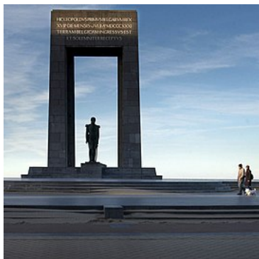
Standbeeld in De Panne