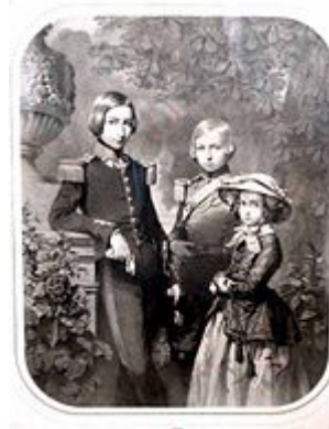
Leopolds drie overlevende kinderen met Louise Marie: Leopold , Charlotte en Filips .