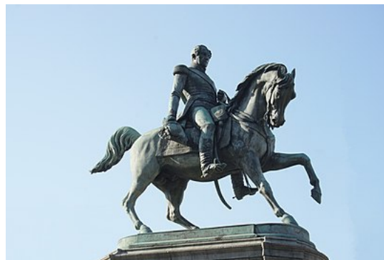
Ruitersstandbeeld in Antwerpen