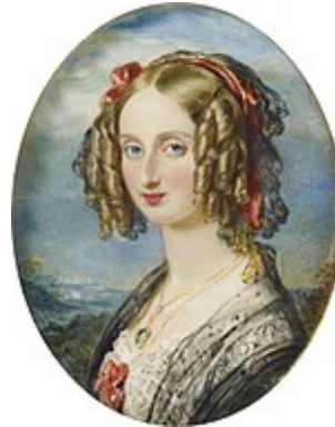
Koningin Louise Marie van Orléans , de eerste Koningin der Belgen en tweede echtgenote van Leopold I