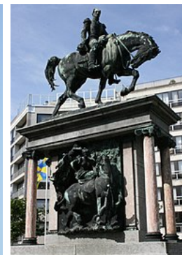
Ruitersstandbeeld in Oostende